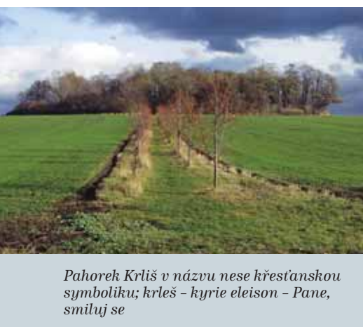
Pahorek Krliš v názvu nese křesťanskou symboliku; krleš - kyrie eleison - Pane, smiluj se

mísení obyvatelstva s kolonizačními proudy nikdy neustalo a fakticky trvá dodnes. Rozhodující bylo a zůstává, k jaké kultuře se hlásíme. Neklidné 9. století v kotlině uzavřené horami uspišilo proces kulturní identifikace více rozdrobených kmenů s jedním etnikem, které jsme si ve zkratce navykli jmenovat Čechy. Prvotní impuls však přišel z plání Bohemie, kde již po řadu generací hospodařili lidé zvaní podle úrodných luk Lučané. Setkali jsme se s nimi již v dobách Sámových, kdy jejich sídelním hradem býval Pšov, jedno z nejstarších slovanských založení na dohled slavnému vítězství u Wogastisburku. Přestože v bojové