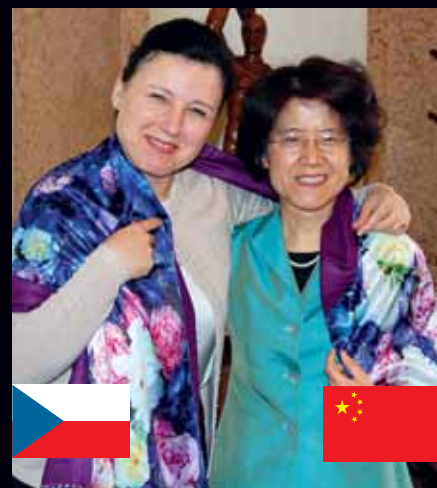
Velvyslankyně Čínské lidové republiky v Česku Její Excelence paní Ma Keqing (napravo) a ministryně pro místní rozvoj České republiky paní Věra Jourová (nalevo).