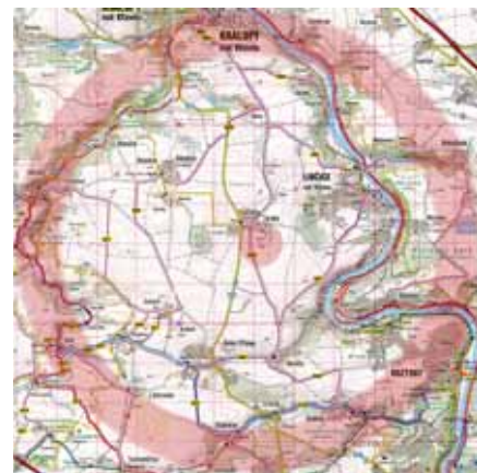
Kruh opisující bojiště na Turském poli zaujímá nejstarší křesťanské kostely na Budči a Levém Hradci, ale také nejstarší část Kralup – slovanské sídliště Míkovice, hrad Okoř nebo dávný brod přes Vltavu u Roztok (mapa ShocArt)

uvádí jako boj dávných pohanů proti pohanům, bitvu prodechnutou kouzly a čarodějnou mocí. Přestože vyvyšuje Čechy (Boemi), přisuzuje jejich vítězství magii, nikoliv vojenskému umění či štěstí. Ve druhé polovině devátého století však byla realita Bohemie již poněkud jiná a zasahují sem vlivy rostoucí Velkomoravské moci. Kronikář jako by cosi zamlčoval. Pahorek, mírná vyvýšenina nad bitevním polem přisuzovaná Tyrově mohyle, z níž neohrožený vůdce Čechům velel, totiž nese pozoruhodný název „Krliš“, ještě v tereziánském mapování z 18. stol. zapisováno jako Krleš. V raně středověkých Čechách zlidovělé Krleš má však původ v řečtině a je liturgickým popěvkem Kyrie eleison – Pane, smiluj se! Kde se vzala křesťanská symbolika na pohanském bojišti? A ještě k tomu pochází z východu, nikoliv jak bychom očekávali ze západního prořímského křesťanství? Pozoruhodná je i poloha bojiště v přímém kontaktu s nejstaršími fundacemi křesťanských kostelů v Čechách, rotundou sv. Klimenta na Levém Hradci a rotundou sv. Petra na Budči. Oba kostely prokazatelně Velkomoravského