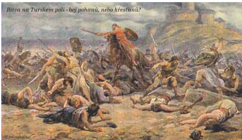
Bitva na Turském poli - boj pohanů, nebo křesťanů?