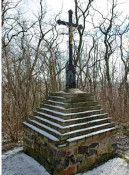
Pomník na tzv. Tyrově mohyle na pahorku Krliš dnes s křesťanským křížem